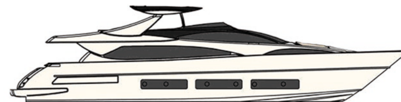
Fly bridge Jacuzzi Optional