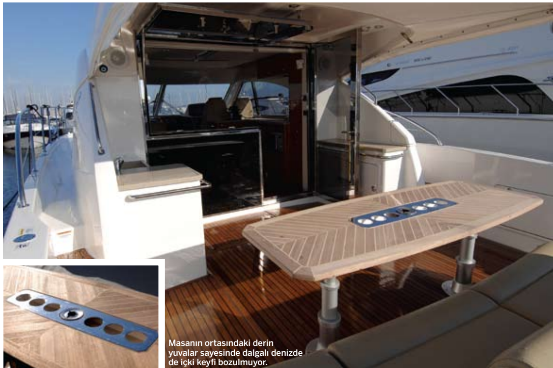
Masanın ortasındaki derin yuvalar sayesinde dalgali denizde de içki keyfi bozulmuyor.

Havuzlukla salonu birbirinden ayıran cam panellerin büyük bir bölümü, istendiğinde kaldırılarak oldukça geniş bir yaşam alanı yaratılıyor.