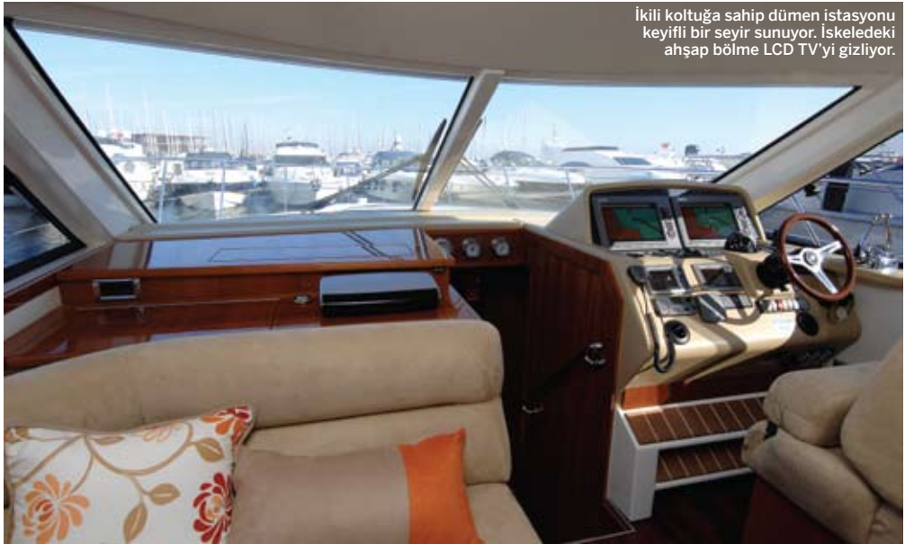
İkili koltuğa sahip dümen istasyonu keyifli bir seyir sunuyor. İskeledeki ahşap bölme LCD TV'yi gizliyor.

Tekne büyüklüğüne rağmen hassas bir şekilde kontrol edilebiliyor. Makinelerden çok hemen hiç ses gelmiyor, titreşim ise yok denecek kadar az.