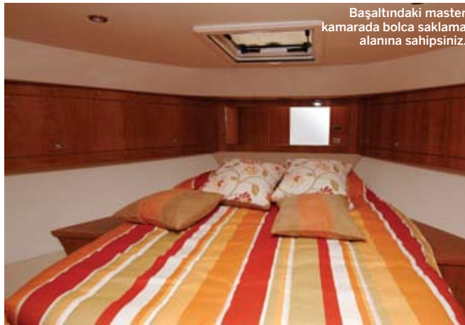
Başaltındaki master kamarada bolca saklama alanına sahipsiniz.