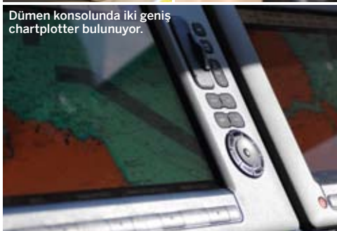
Dümen konsolunda iki geniş chartplotter bulunuyor.