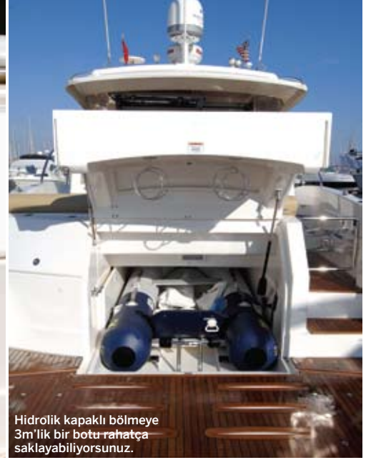
Hidrolik kapaklı bölmeye 3m'lik bir botu rahatça saklayabiliyorsunuz.