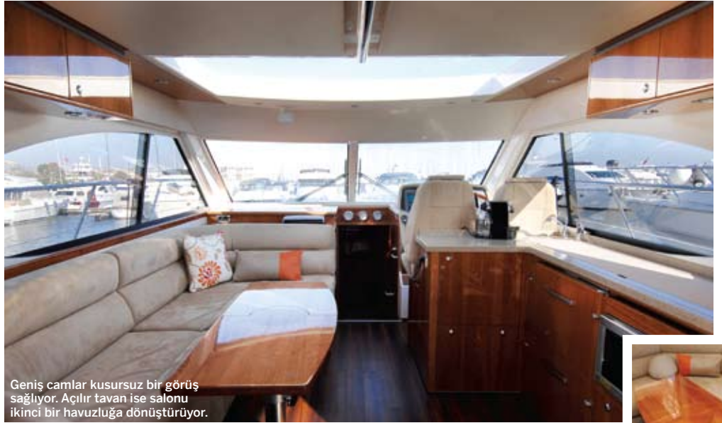
Geniş camlar kusursuz bir görüş sağlıyor. Açılır tavan ise salonu ikinci bir havuzluğa dönüştürüyor.

Teknedeki tüm mobilyalar müşteri tercihiyle göre değişen ahşap kaplamaya sahipler. Kaplama ve vernik işçiliği başarılı. Hatch ve lombozlar vasıtasıyla gün boyu bolca güneş ışığının girdiği >>>