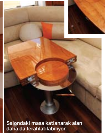
Salondaki masa katlanarak alan daha da ferahlatılabilir.

Havuzlukla salonu birbirinden ayıran cam panellerin büyük bir bölümü, istendiğinde kaldırılarak oldukça geniş bir yaşam alanı yaratılıyor.