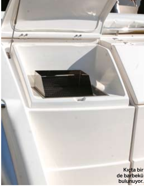
Kıçta bir de barbekü bulunuyor.

Teknenin fiyatı 1 milyon 200 bin Dolar'dan başlıyor ve ekstra aksesuarlara göre değişebiliyor, yine de test teknemizde gereken her türlü konforun bulunduğunu düşünürsek ekstreya pek bir şey kalmayacağını söyleyebiliriz. Sonuç olarak bir motoryata ayıracak bu kadar bir bütçeniz varsa Riviera 5000 Sport Yacht kesinlikle düşünülmesi gereken bir alternatif. Yakından incelemek isteyenler, şubat ayındaki Avrasya Boat Show'da 1. Hall'da tekneyi ziyaret edebilirler. MBY